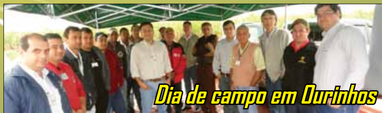
Dia de campo em Ourinhos