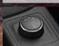
Seletor Eletrônico de Tração 2

1180 cv com 47,9 kgfm de torque 1.039 kg de capacidade de carga 3