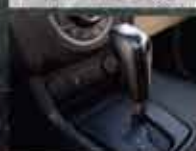
Câmbio automática de 6 velocidades com Active Select 1