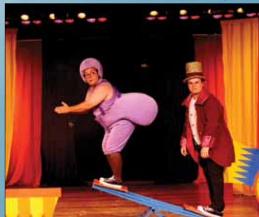
Em Adamantina o espetáculo será dia 30 de setembro, no ATC

Eles brincam com o que não existe, brincam com aquilo que está na imaginação. Brincam com o pensamento! Nesse brincar pode-se reinventar os universos familiares, as relações amorosas e construir um pensamento coerente e criativo. A Cia. Circo de Bonecos propõe resgatar o encantamento e a delicadeza do antigo Circo de Pulgas, ao mesmo