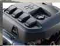
Novo motor Chevrolet 2.8 Turbo Diesel, o mais forte da categoria