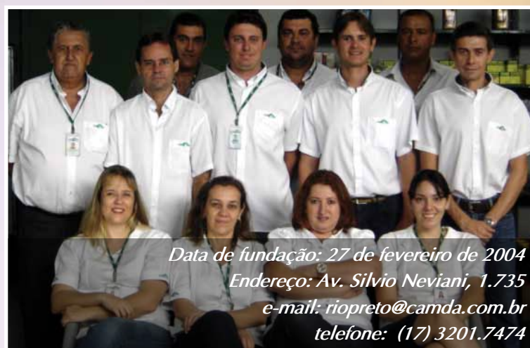
Data de fundação: 27 de fevereiro de 2004 Endereço: Av. Sívlio Neviani, 1.735 e-mail: riopreto@camda.com.br telefone: (17) 3201.7474

Desde o ano de 1990 a Camda vem atuando em Jaú no atendimento de centenas de agricultores de cana-de-açúcar, que encontram na cooperativa um balizar de custos, especialmente na área de insumos. A atuação de sua equipe técnica, sempre presente nas propriedades dos cooperados, é considerada um exemplo de competência e dedicação. Trabalham também com pecuaristas da região, fornecendo os mais avançados produtos relacionados à área. Hoje 11 funcionários trabalham na filial de Jaú.