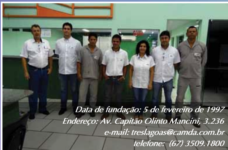
Data de fundação: 5 de fevereiro de 1997 Endereço: Av. Capitão Olinto Mancini, 3.236 e-mail: treslagoas@camda.com.br telefone: (67) 3509.1800