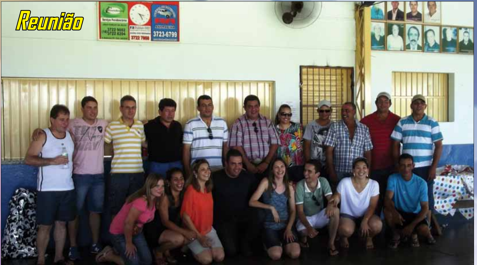
Encontro final entre os colaboradores Camda da loja e silo de Andradina no clube Rolex

“Gostaríamos de agradecer a todos os cooperados que prestigiaram o evento e todos os funcionários da filial Rio Preto que colaboraram para o sucesso de mais esta ação”, finalizou o gerente da filial Camda.