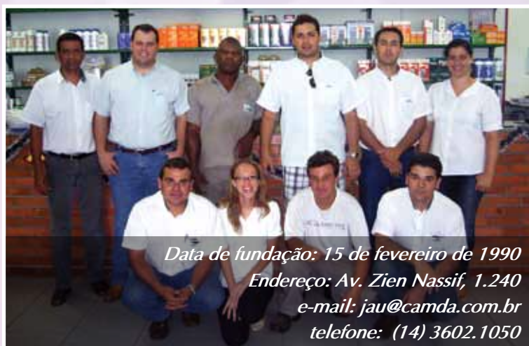
Data de fundação: 15 de fevereiro de 1990 Endereço: Av. Zien Nassif, 1.240 e-mail: jau@camda.com.br telefone: (14) 3602.1050

Há 5 anos foi instalado em Andradina um espaço com silos graneleiros - estes utilizados para armazenar a matéria-prima da produção de milho. Já no mercado há muitos anos, a ração MinerCamda é feita a partir de grãos de trigo, milho e soja selecionados de acordo com critérios rigorosos de pureza e qualidade, e esta foi uma das razões da instalação deste silo em Andradina. Com capacidade para o armazenamento da produção de grãos da região, o silo é uma segurança para os cooperados, que podem depositar e vender os seus produtos por melhores preços. A filial conta atualmente com 4 funcionários.