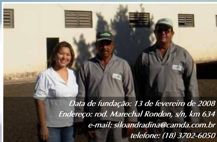
Data de fundação: 13 de fevereiro de 2008 Endereço: rod. Marechal Rondon, s/n, km 634 e-mail: siloandradina@camda.com.br telefone: (18) 3702-6050

Há 16 anos a Camda se instalou em Três Lagoas para atuar principalmente no setor da pecuária, especialmente na prestação de serviços de assistência por veterinários e zootecnistas, além do fornecimento de sal mineral e ração que é produzida pela própria cooperativa. Apesar de a pecuária ser a atividade tradicional do município, existe a necessidade da implantação de novas culturas para melhorar a capacidade de suporte de gado. A Camda vem atuando também na conscientização dos produtores para a necessidade da reforma nas pastagens. Atualmente a unidade tem 12 funcionários atuando para o bem-estar dos associados.