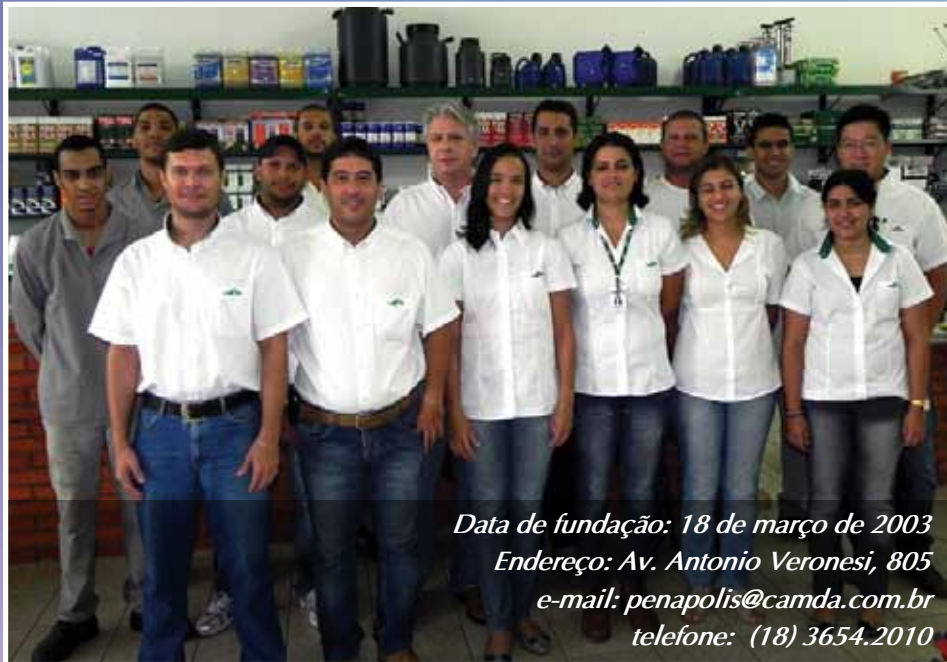
Data de fundação: 18 de março de 2003 Endereço: Av. Antonio Veronesi, 805 e-mail: penapolis@camda.com.br telefone: (18) 3654.2010