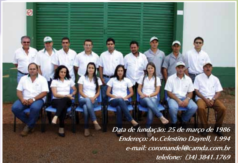
Data de fundação: 25 de março de 1986 Endereço: Av. Celestino Dayrell, 1.994 e-mail: coromandel@camda.com.br telefone: (34) 3841.1769

A Camda participa da história de Coromandel desde 1986, quando implantou um projeto inovador para o plantio de café, agregando mais de 20 agricultores que hoje festejam a iniciativa. Além das instalações que compreendem a loja e o departamento de assistência técnica aos agricultores, a filial possui também um grande armazém para recebimento, beneficiamento e comercialização do café, incluindo o rebeneficiamento dos grãos. Hoje, com a diversificação das culturas da região, o verde dos cafezais vem ganhando novas matizes com as lavouras de soja e milho; e o gado leiteiro desponta como mais uma alternativa de negócios. Hoje 16 funcionários trabalham na filial de Coromandel.