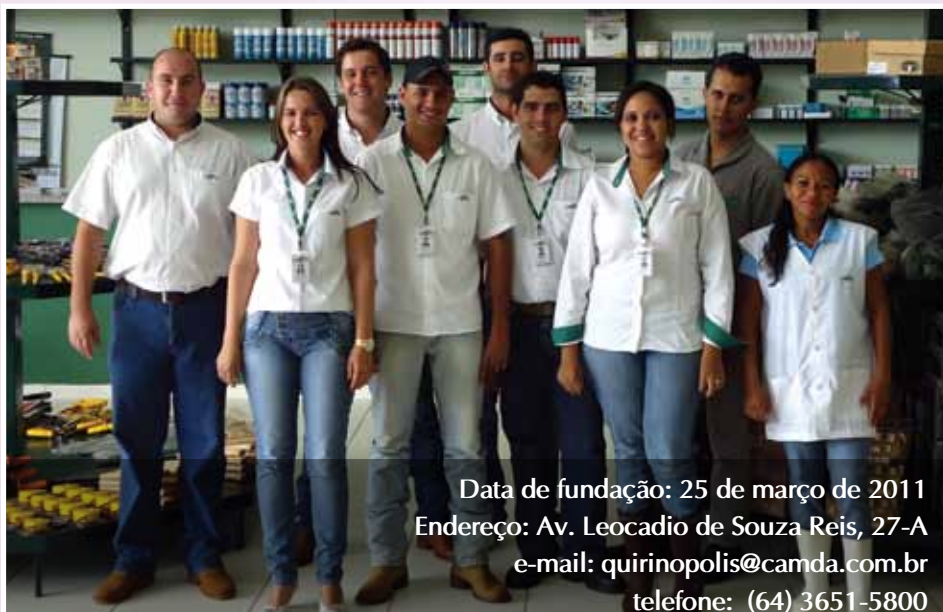
Data de fundação: 25 de março de 2011 Endereço: Av. Leocádio de Souza Reis, 27-A e-mail: quirinopolis@camda.com.br telefone: (64) 3651-5800