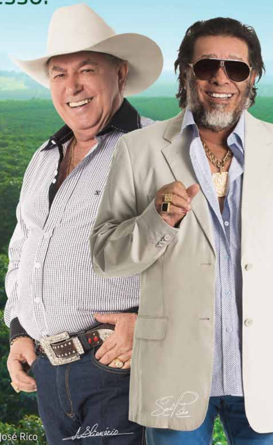
Milionário & José Rico

Como simplifica? A associação das moléculas inseticida e fungicida na formulação de Pratico, aliada à tecnologia de formulação da Makhteshim Agan de Israel, confere rápida absorção e redistribuição dentro da planta, resultando em Vigor e Controle por mais tempo.