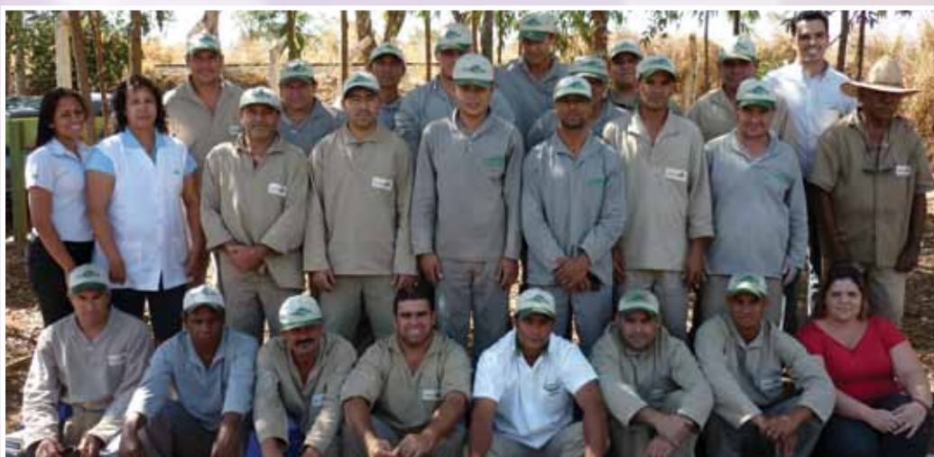
Reprodução da foto:

Acolhendo os pedidos dos nossos cooperados, mais uma unidade da Camda foi inaugurada em Minas Gerais: a cidade escolhida Iturama. Este nome significa “região das quedas d’água”, provavelmente em referência às grandes cachoeiras que existiam no local. A economia é baseada na agricultura e pastoreiro, na plantação de cana-de-açúcar, produção do álcool e na prestação de serviços – sendo assim, foco diretamente ligado ao trabalho do associado. A cooperativa investiu com o intuito de proporcionar melhores opções para o agronegócio de seus cooperados. Atualmente a unidade tem 14 funcionários atuantes.