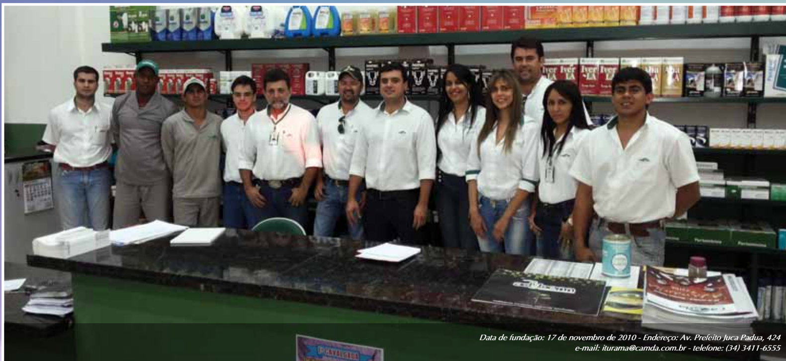
Data de fundação: 17 de novembro de 2010 - Endereço: Av. Prefeito Juca Padua, 424 e-mail: iturama@camda.com.br - telefone: (34) 3411-6555