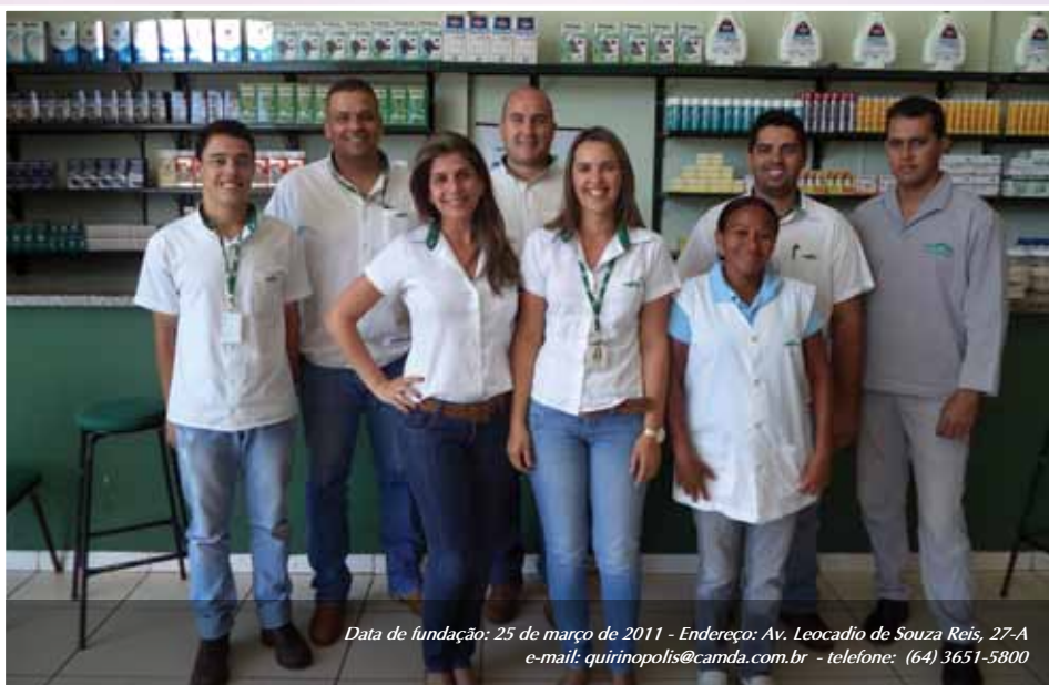
Data de fundação: 25 de março de 2011 - Endereço: Av. Leocádio de Souza Reis, 27-A e-mail: quirinopolis@camda.com.br - telefone: (64) 3651-5800