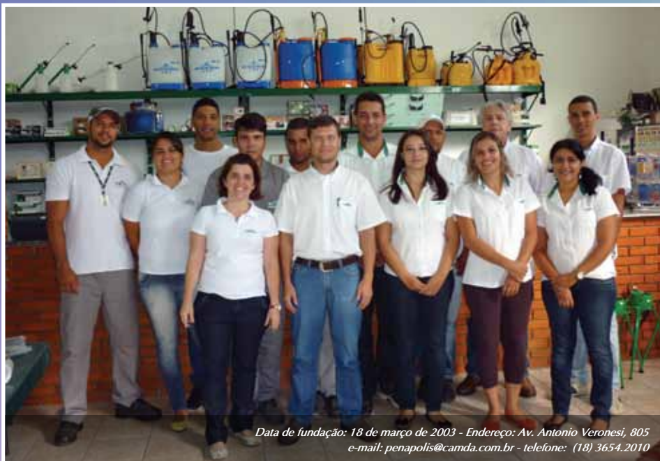
Data de fundação: 18 de março de 2003 - Endereço: Av. Antonio Veronesi, 805 e-mail: penapolis@camda.com.br - telefone: (18) 3654.2010