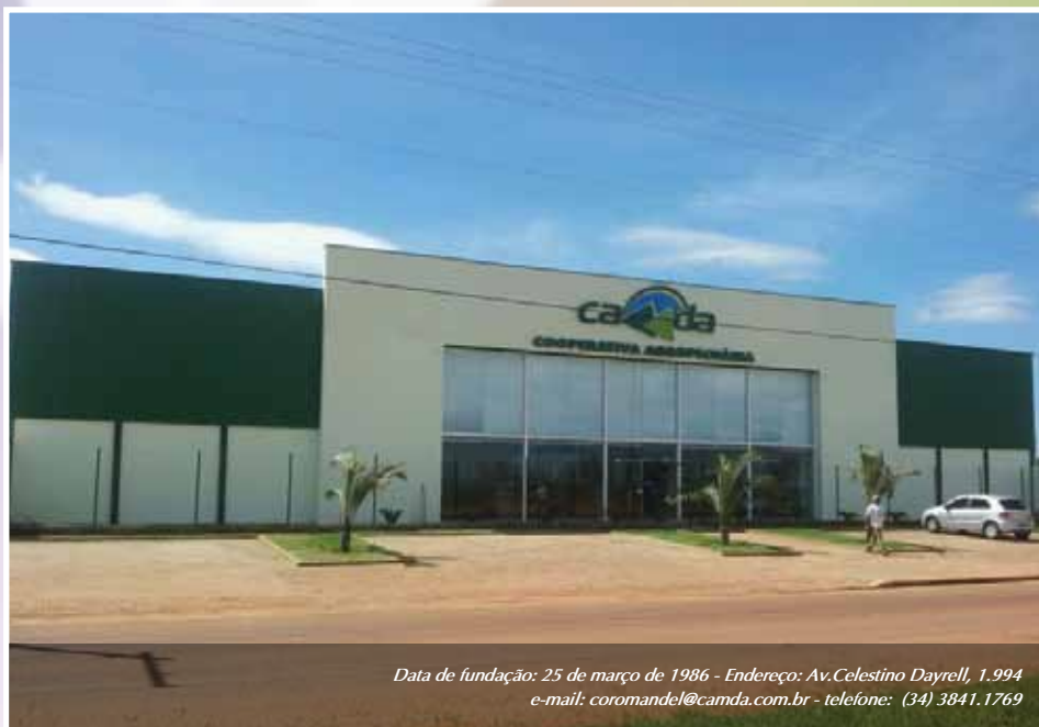
Data de fundação: 25 de março de 1986 - Endereço: Av. Celestino Dayrell, 1.994 e-mail: coromandel@camda.com.br - telefone: (34) 3841.1769